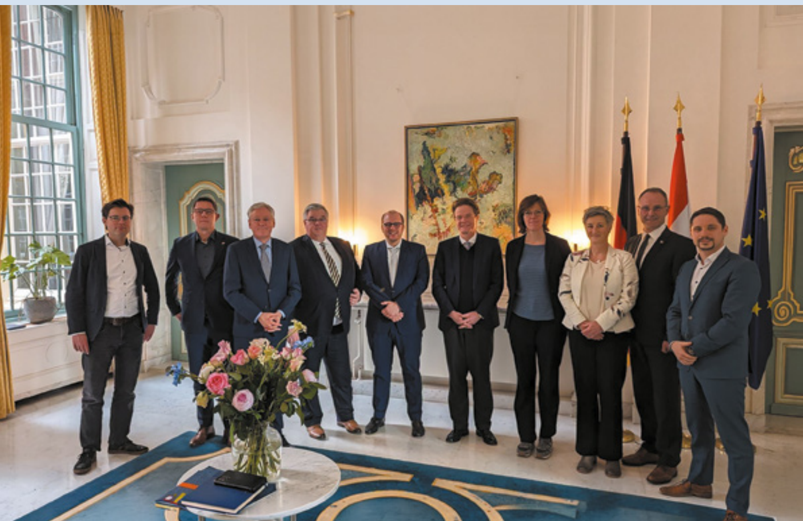
Die Euregios zu Gast beim deutschen Botschafter in Den Haag / De Euregio's te gast bij de Duitse ambassadeur in Den Haag