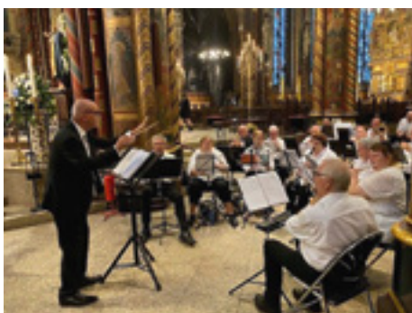
“Ieders klank is anders, maar samen zorgen deze Nederlandse muzikanten voor harmonie in een gastvrije Duitse kerk” van Josefa Janssen , 2 de prijs Nederland.