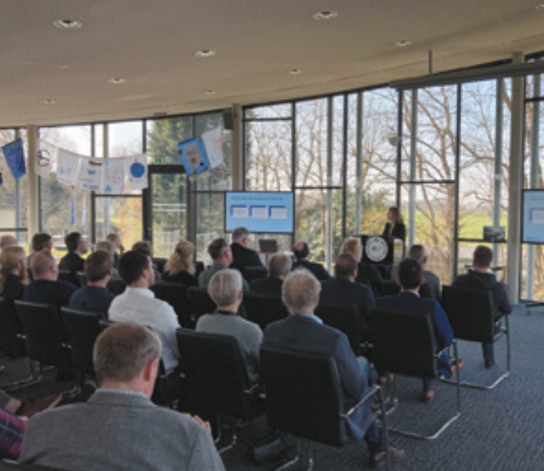
Netzwerkveranstaltung Euregiorat Netzwerkbijeenkomst Euregioraad