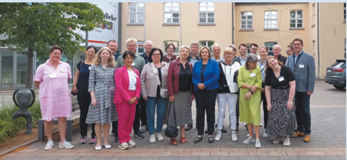
Kontaktpersonentag / Contactpersonendag - Dinslaken

subsidiemogelijkheden voor grote en kleine projecten in het kader van het EU-programma Interreg VIA Deutschland-Nederland toe. Aanluitend informeerde secretaris Andreas Kochs de leden over de ontwikkelingen met betrekking tot de nieuwe EU-subsidieperiode vanaf 2028. De dag werd voortgezet met een rondleiding in het museum en een stadswandeling met gids door Dinslaken. De middag stond in het teken van stadsontwikkeling. De contactpersonen brachten een bezoek aan het terrein van de voormalig kolenmijn Zeche Lohberg. Deze mijn is in 2005 stil gelegd en het terrein wordt helemaal opnieuw ingericht met onder andere een cultuurcentrum en een leer-werkhotel van de Caritas, waar men afsluitend nog ruimschoots de gelegenheid om met elkaar in gesprek te komen onder het genot van een hapje en drankje. Kortom, een succesvolle en afwisselende dag, die zeker een bijdrage zal leveren aan een versterkte euregionale samenwerking.