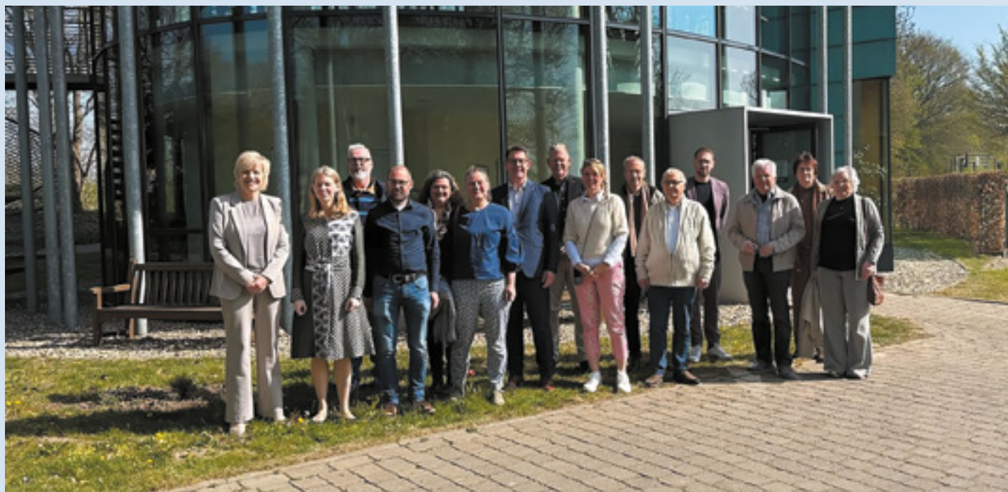
Delegation des Gemeinderats von Renkum Delegatie Gemeenteraad van Renkum