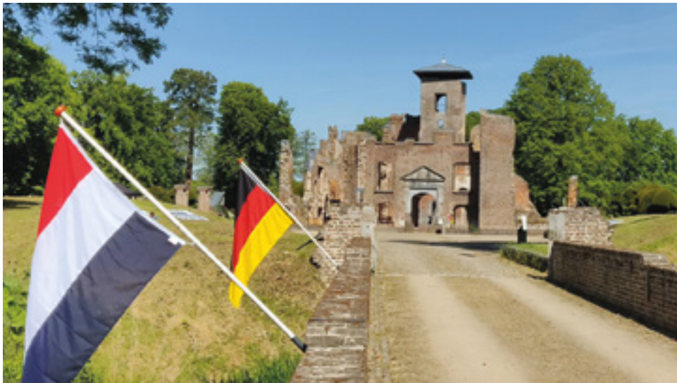
“80 jaar samen anders” van Cindy van Hooff , 1 ste prijs Nederland.