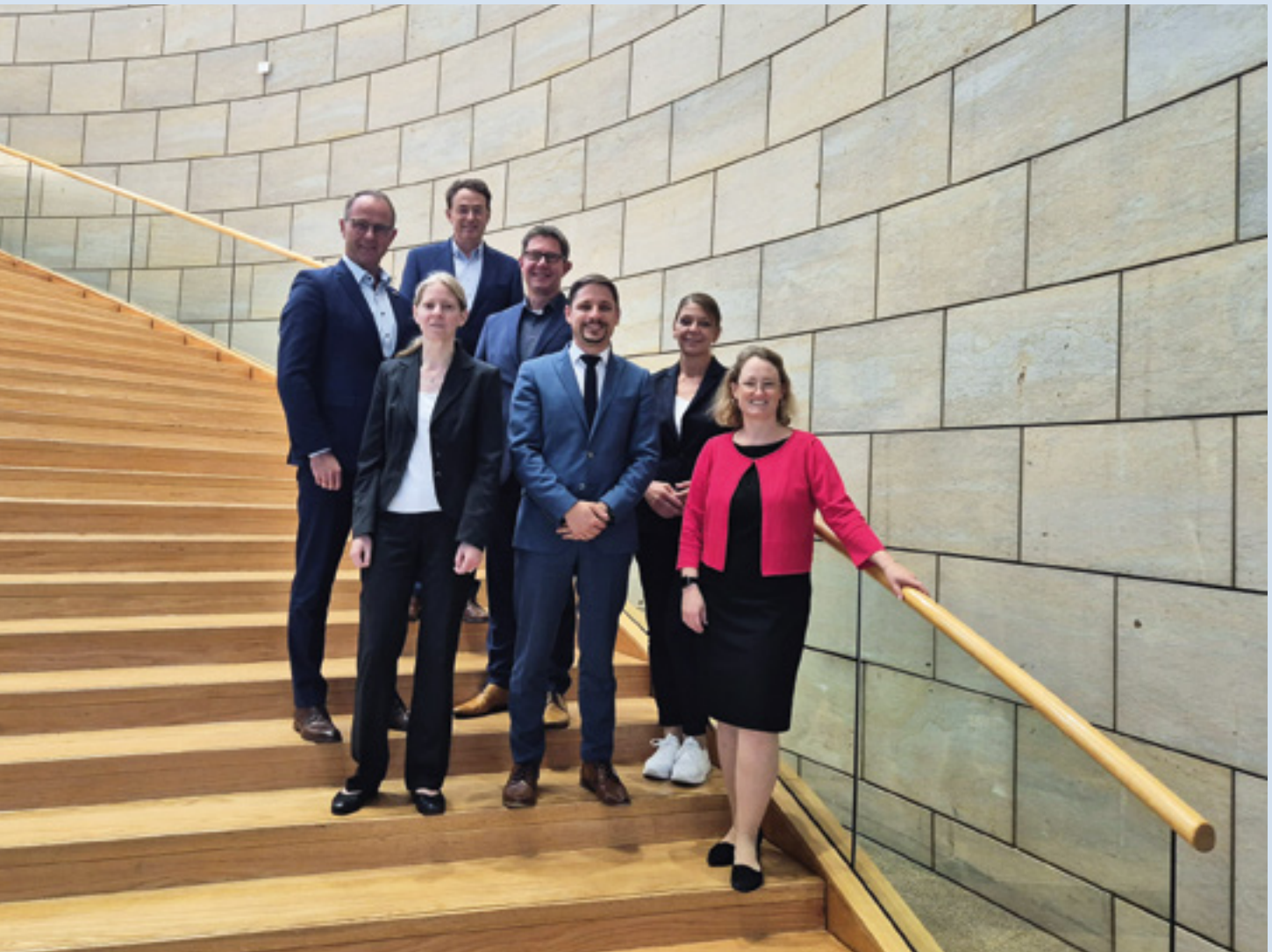
Euregio-GeschäftsführerInnen im Landtag von Nordrhein-Westfalen / Euregio-directeuren in de Landtag van Nordrhein-Westfalen