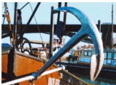
“Hoffnung” von Magdalene Bodden , 2. Preis Deutschland.